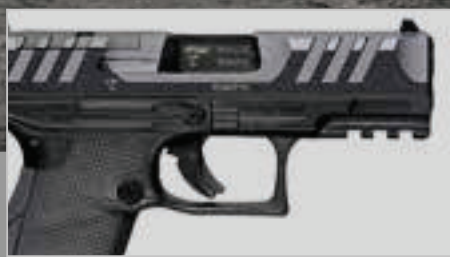
Walther PDP Ein technischer Leckerbissen