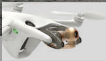
Parrot ANAFI Ai Bionik zum Selberfliegen