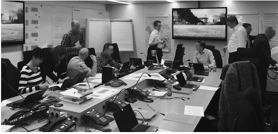
Abbildung 1: Krisenstab eines Luftfahrtunternehmens bei einer Übung