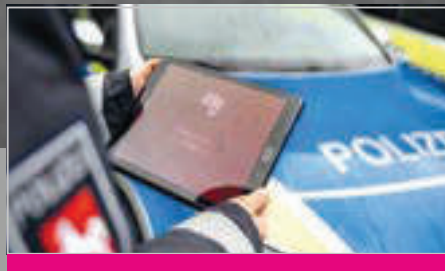
Netzinfrastuktur In Vier Phasen zum Breitbandfunknetz