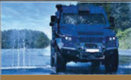
SURVIVOR R Fahrdynamik auf und abseits der Straße